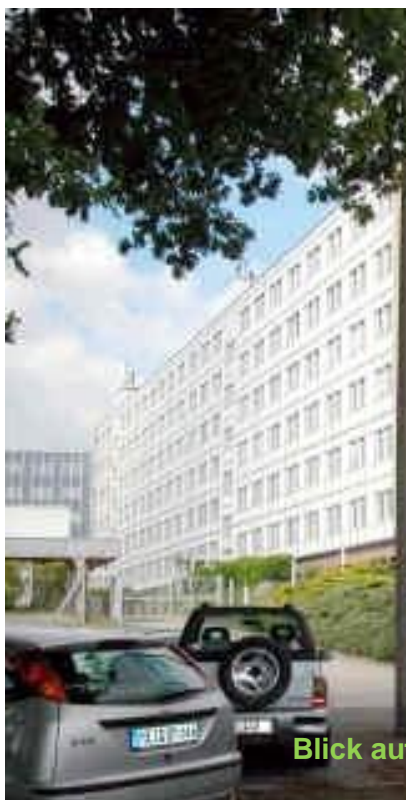
Blick auf Haus 3 mit großzügigem Parkplatz