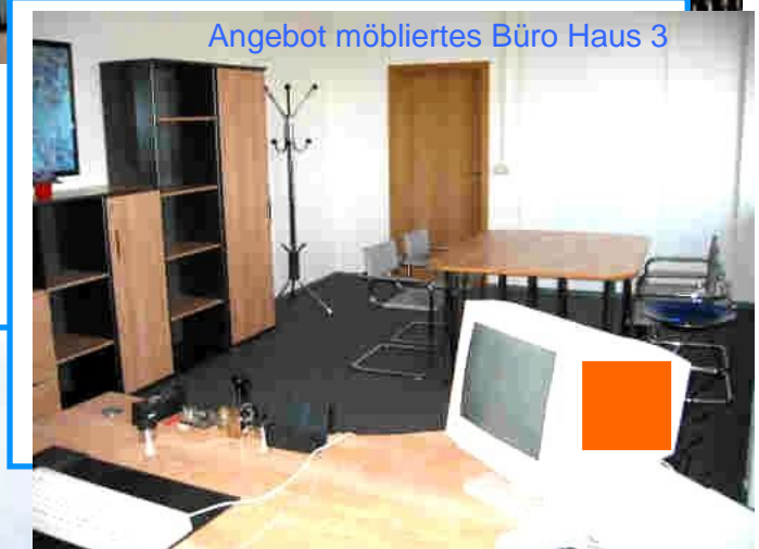
Angebot möbliertes Büro Haus 3