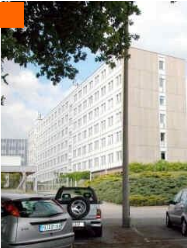
Blick auf Haus 3 mit großzügigem Parkplatz